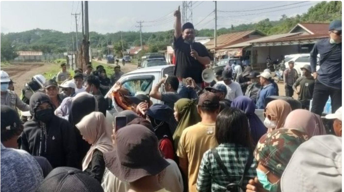
Tampak Korlap Aksi Demo Menyampaikan Orasinya di depan Kantor AFB Desa Lalampu

MOROWALI, Sulawesi Tengah- Tuntutan Aksi Demo yang dilakukan sejumlah warga Desa Lalampu masih menunggu keputusan dari PT Ang and Fang Brother (AFB) perusahaan tambang yang berlokasi di desa tersebut.