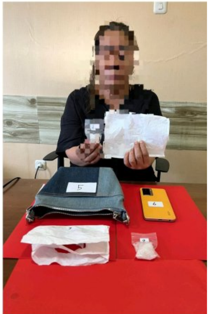
Tampak 2 wanita di tangkap Satreskoba Polres Morowali

MOROWALI, Sulawesi Tengah- Satuan Reserse Narkoba Polres Morowali Polda Sulteng, berhasil mengungkap kasus penyalahgunaan narkotika jenis sabu di Desa Topogaro, Kecamatan Bungku Barat, Kabupaten Morowali Propinsi