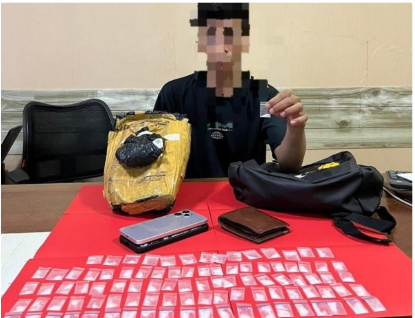
seorang pria berinisial RF (22 tahun) bersama Babuk Sabu

MOROWALI, Sulawesi Tengah- Personel Satuan Reserse Narkoba (Satresnarkoba) Polres Morowali kembali menunjukkan komitmennya dalam memberantas peredaran narkotika di wilayah hukumnya pada hari Senin pagi